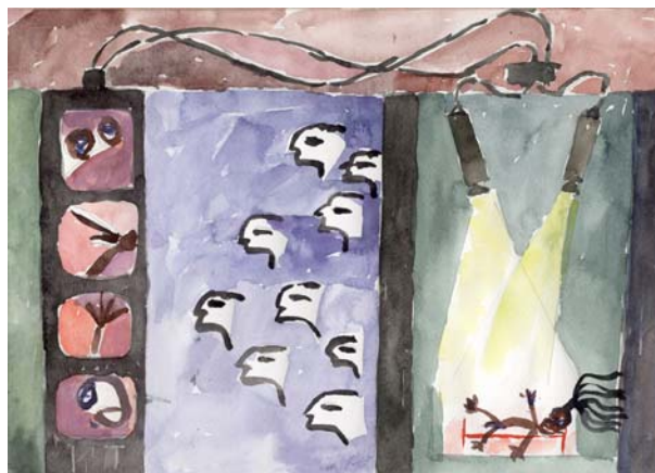
Kunstwettbewerb: „Video-EEG“ (R. Thorbecke 1996)

Auf die längere Sicht ist dies jedoch nicht ausreichend. Gegenwärtig braucht es ein Bündel unterschiedlicher Maßnahmen und großer, gemeinsamer Anstrengungen, die Zukunft dieses Forschungsgebiets zu sichern. Wenn keine zusätzlichen Ressourcen aufgetan werden können oder die jetzigen limitiert werden, ist die Epilepsieforschung auf dem gegenwärtigen Niveau in Frage gestellt.